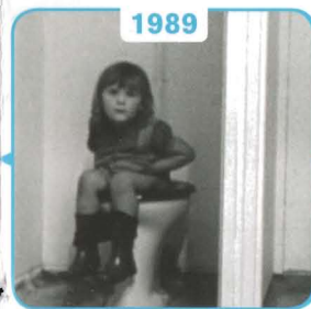
1989 Stimuleringsmaatregel Kinderopvang