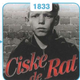
1833 Eerste jeugdgevangenis in Rotterdam