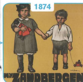
1874 Maatschappij tot Opvoeding van Weezen in het Huisgezin