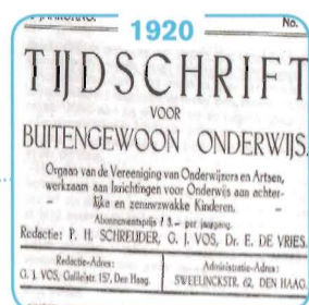
1920 Speciaal onderwijs voor moeilijke kinderen