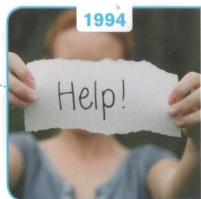
1994 Bureau Jeugdzorg