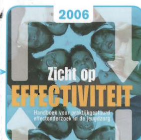
2006 Databank Effectieve Jeugdinterventies