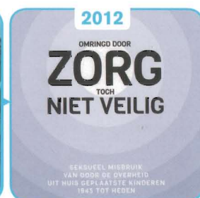
2012 Seksueel misbruik en de commissies-Deetman/Samson