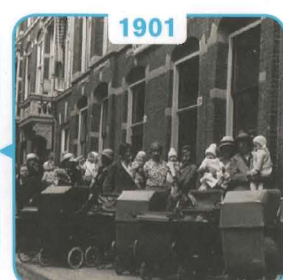
1901 Eerste consultatiebureau in Den Haag