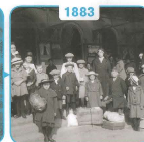
1883 Vakantiekolonies voor bleekneusjes en zenuwpeesjes