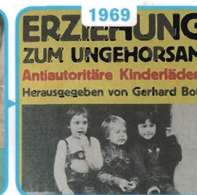
1969 Op zoek naar modern ouderschap