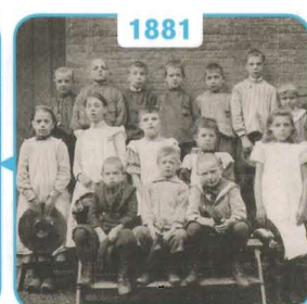
1881 Jan Klootsema en de ontwikkeling van de orthopedagogiek