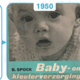
1950 Dr. Spock

Als na 1945 duizenden 'oorlogskinderen' opgevangen en geresocialiseerd moeten worden, breekt de overtuiging door dat daarvoor geschoold personeel nodig is. Er worden diverse parttime cursussen opgezet die de scholingsachterstand van medewerkers in de kinderenbescherming moeten wegwerken. Deze tijdelijke noodopleidingen ontwikkelen zich verder tot ze begin jaren zeventig, plaats maken voor voltijdse mbo- en hbo-opleidingen inrichtingswerk.