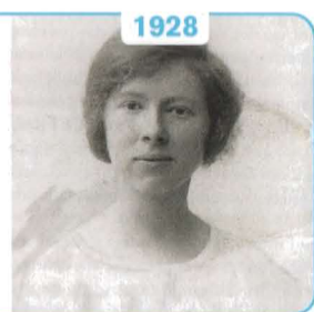
1928 Medisch-Opvoedkundige Bureaus