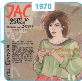
1970 Jongeren Advies Centrum (JAC)