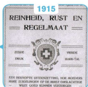
1915 Reinheid, Rust, Regelmaat