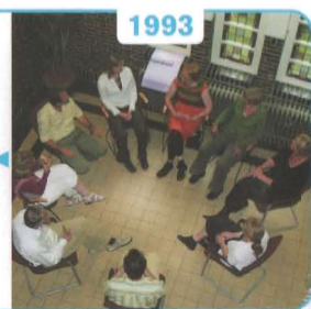
1993 Families First

De groeiende twijfel over de effectiviteit van het uit huis plaatsen van kinderen, leidt in 1993 tot de introductie van het uit de VS afkomstige programma Families First. In dezelfde periode ontstaan er veel varianten van hulp in het gezin. Een inventarisatie in 2001 telt 56 varianten, aangeboden door tachtig instellingen. Ongeveer vijftien van deze programma's hebben hun weg gevonden naar de databank Effectieve Jeugdinterventies, dat wil zeggen dat ze theoretisch goed onderbouwd dan wel effectief zijn.