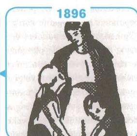
1896 Pro Juventute