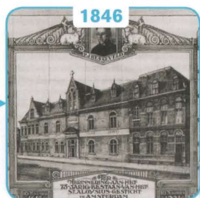
1846 Het Sint Aloysiusgesticht