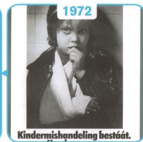
1972 Vertrouwensartsen kindermishandeling