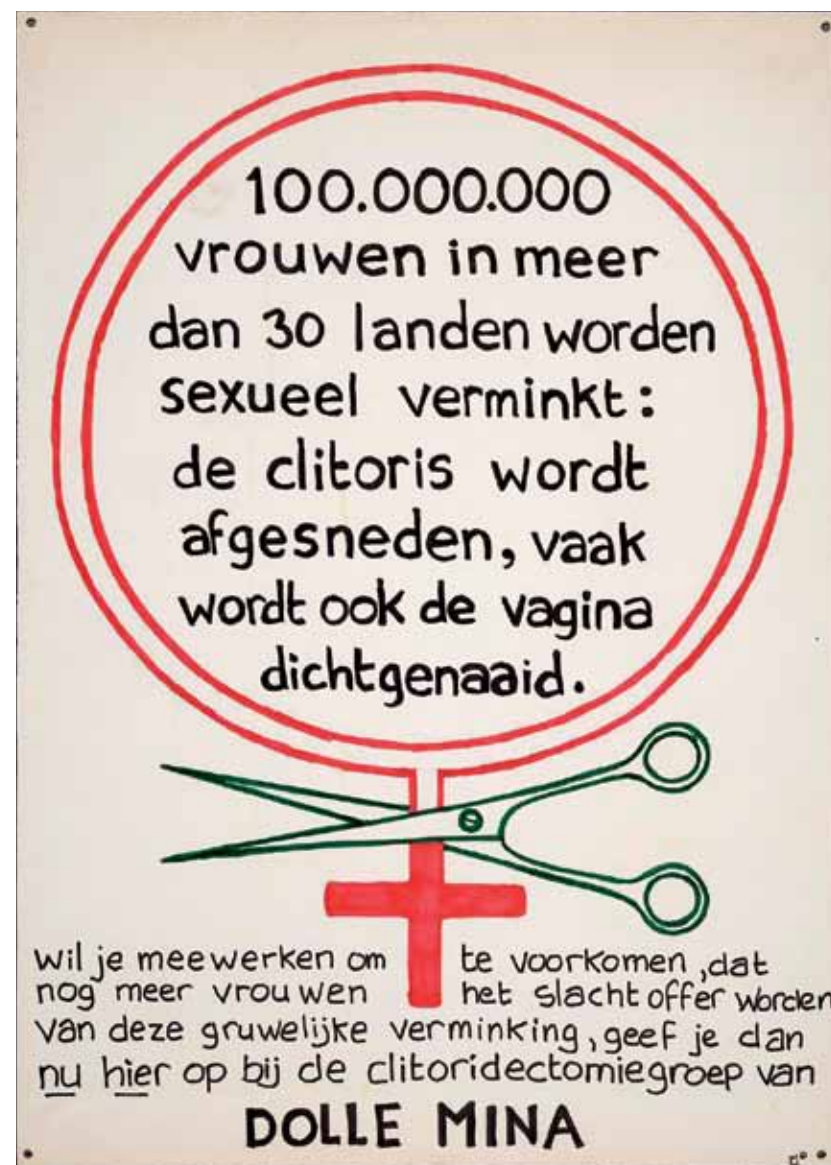
'Dolle Mina' voert actie tegen clitoridectomie.

VERKRACHTING IN HET HUWELIJK BESTAÁT! vrouwen tegen verkrachting