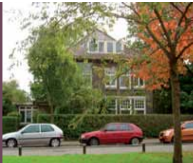
Pand van Cassandra te Leiden