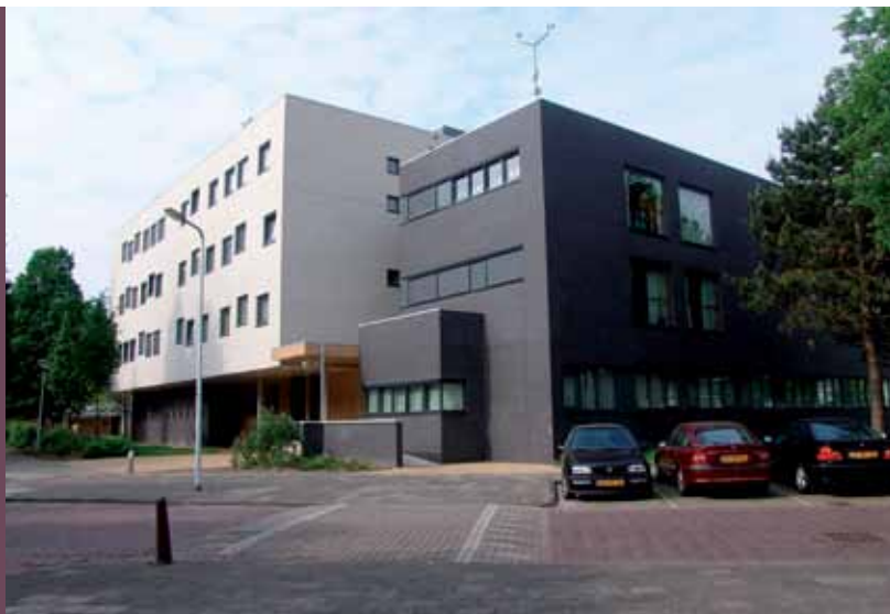
Pand van Vrouwenopvang Rosa Manus te Leiden