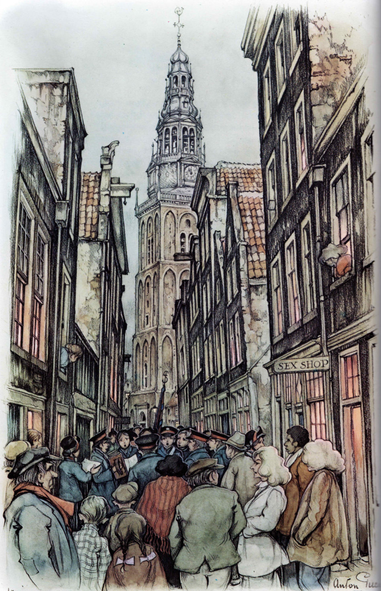
H. Ammelsstraat Amsterdam