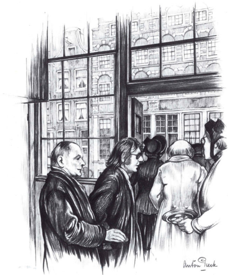
Einde van de samenkomst in de Pruytenbuigh

En dan, op 19 februari 1959, spreekt ineens heel Nederland van 'de majoor'. 'Ik was in oktober '58 benaderd vanuit Laren, of ik daar voor een of andere kring een lezing wilde houden,' vertelt ze, 'maar ik vond het wel een rare club. Ze belden altijd maar op of er toch niks tussen kwam, en of ze er toch echt op konden rekenen. Ja, en wat ook zo