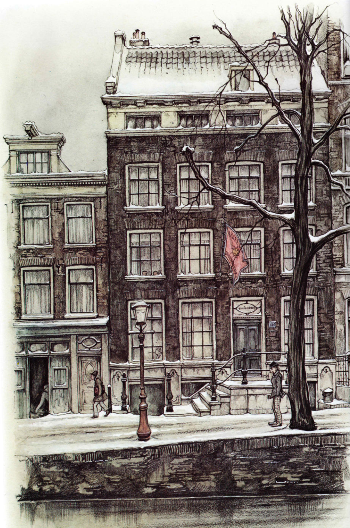
.. De Gastenburgh ..