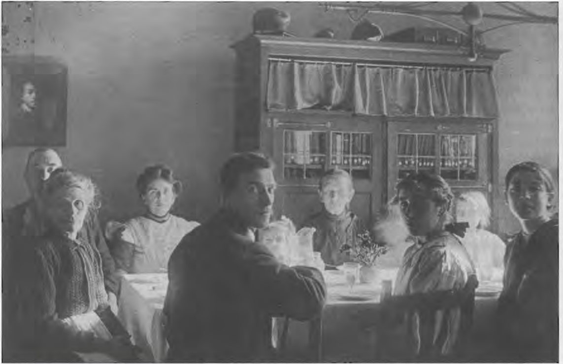
Tijdens de Eerste Wereldoorlog verbleven er Belgische vluchtelingen in het Volkshuis.