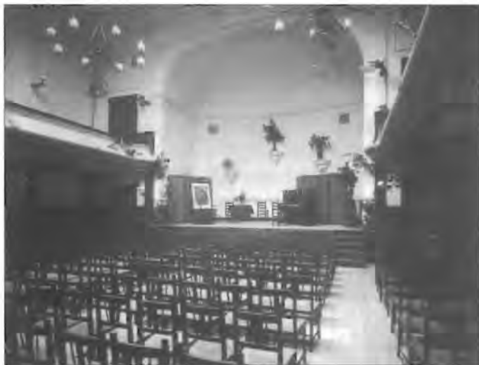
De grote zaal rond 1900.