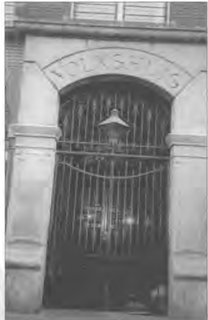
De ingang aan de Haarlemmerstraat, die nu uitsluitend nog toegang geeft tot de appartementen.