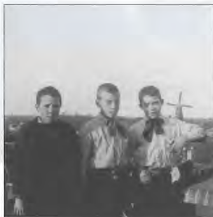
Begin van de twintigste eeuw. Drie jongens op het dak.