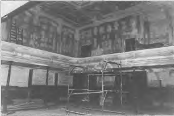
De grote zaal wordt verbouwd. 1980.

aarzelde niet lang om Peter van Swieten, de 'huisarchitect' van het Volkshuis in te schakelen om voor de woonruimten een plan te ontwikkelen. Omdat de Stichting Beheer – toen nog eigenaresse van de huizen – er niet op korte termijn in slaagde de huurcontracten met de winkeliers te wijzigen, dreigde door de langdurige haarkloverijen de subsidietermijn van gemeente en rijk te verlopen. De stichting droeg toen de huizen en het plan van Van Swieten over aan de gemeente waardoor de renovatie kon beginnen. Deze is inmiddels al weer vier jaar achter de rug en mag zeer geslaagd worden genoemd. Het grote voordeel voor de winkeliers is dat de huurders niet meer door hun zaak hoeven, maar hun appartement kunnen bereiken via de uitgang aan de Haarlemmerstraat. Een en ander is een bijzonder goed voorbeeld van het idee 'Wonen boven Winkels'.