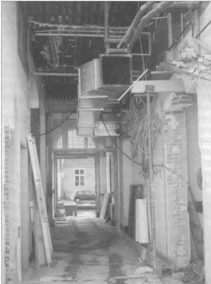
Op 26 april 1999 was het gebouw geheel onttakeld en kon met de opbouw worden begonnen. Een doorkijkje naar de linkervoorduur.

Die verleiding waar juffrouw Knappert in dit stukje uit de Hollandsche Revue van 25 september 1915 op doelt, moet wel Leidens