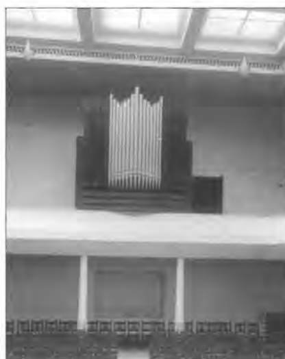
De gemoderniseerde grote zaal met het kerkorgel van de Vrijzinnig Hervormde Gemeente. Eind jaren dertig. Let op de daklichten in de zoldering.