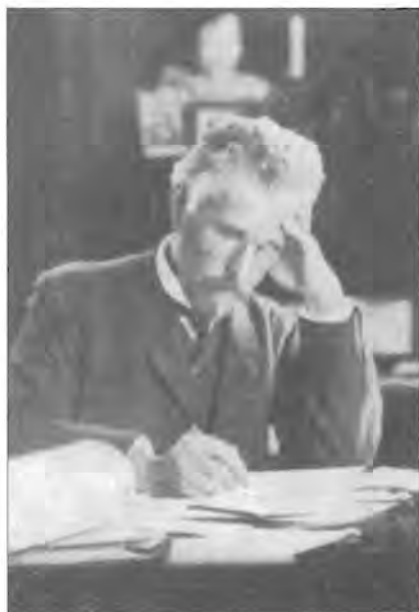
De architect, W.C. Mulder. Uit het weekblad De Bouwwereld , 4 december 1920.

zijn interesse. Zo ontwierp hij in 1883, bij het gouden jubileum van zijn leermeester een massief zilveren beeld dat ieders goedkeuring kon wegdragen.