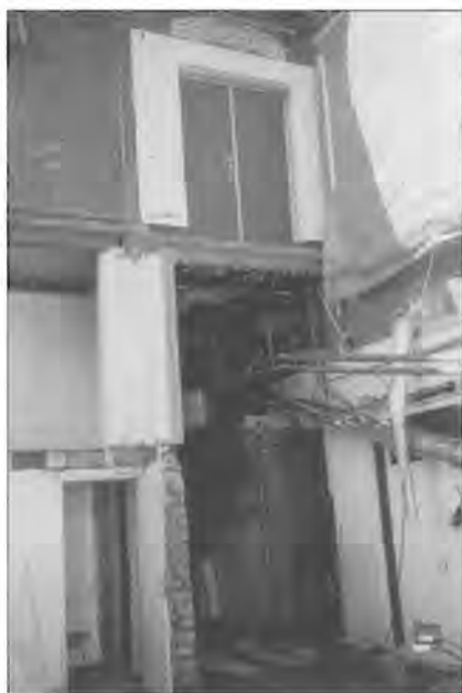
Een grondige verbouwing van de ruimten in het Volkshuis was nodig. Hier wordt de voormalige ontmoetingsruimte van jongerencentrum Stats aangepakt.

rosse buurt De Camp zijn geweest die de bezoekers konden bereiken door een steeg in te lopen die vrijwel recht tegenover de uitgang aan de Haarlemmerstraatzijde lag.