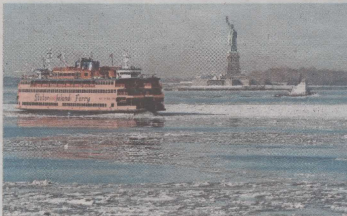
UITZICHT Vrijheidsbeeld en de ferry naar Staten Island.

Een thuis is belangrijk. Ergens bijhoren is belangrijk, bijna zo belangrijk als liefde. Een oude film kijken op de bank is