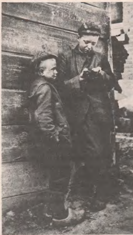
BOFFJES Naar een negatief van W.L. Greve.