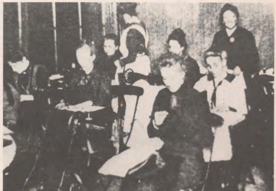
10. Naaiatelier, begin 20e eeuw.