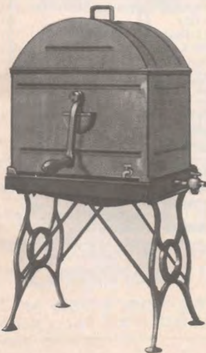
21. Stoomwasmachine 1884.