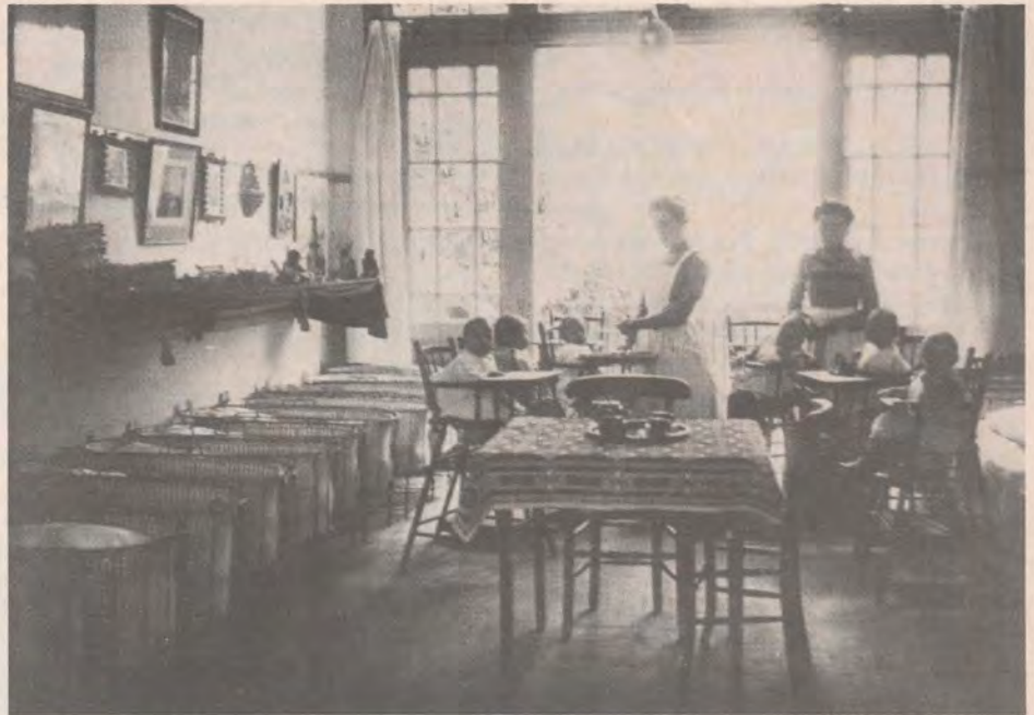
22. Crèche, begin 20e eeuw.

(uit: 'Evolutie, weekblad voor de vrouw', 17 augustus 1893)