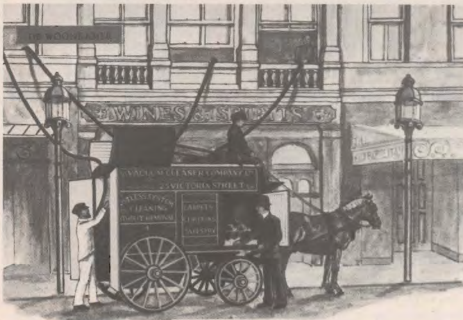
18. Straatstofzuiger, 1901.

Ga na hoe de verschillende maatschappelijke en politieke stromingen hier nu over denken. Vergelijk de argumenten van tegenwoordig eens met die van vroeger.