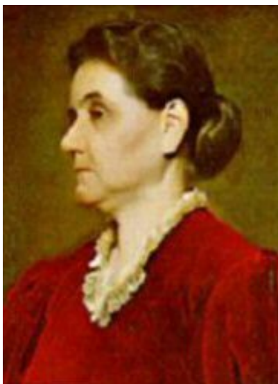
Afbeelding 2 Jane Addams, Nobelprijs voor de Vrede 1931.