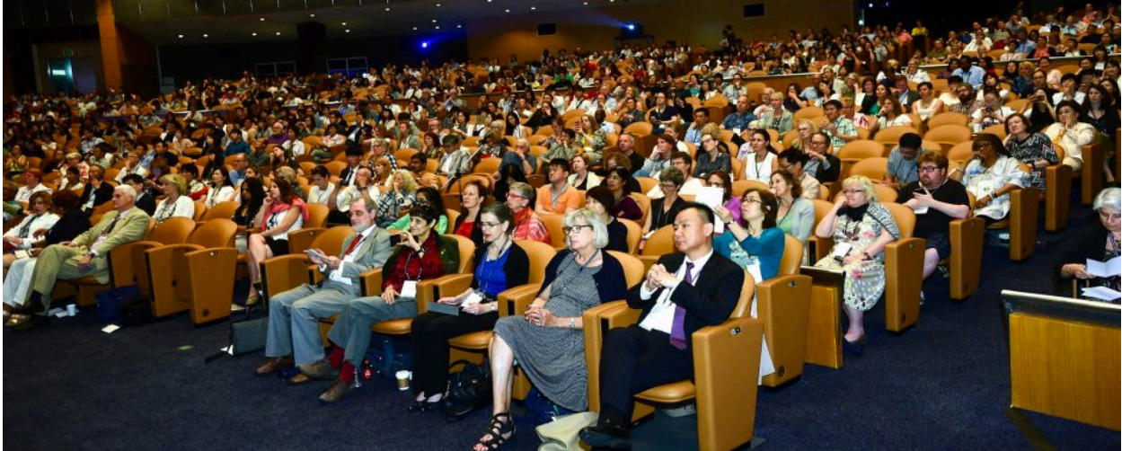
Afbeelding 5 IASSW Seoul, juni 2016

“Het goede dat we voor onszelf reserveren is delicaat en onzeker tot ieder van ons ervan kan genieten en het in ieders gewone leven opgenomen werd.” (Jane ADDAMS)