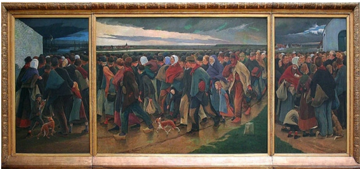
Afbeelding 1 De landverhuizers, Eugène Laermans, 1896

De vele maatschappelijke problemen brachten tegelijkertijd de opmars van de vrouwenbeweging, van het socialisme en het anarchisme. 8 Eisen voor algemeen stemrecht, voor een hoger loon en voor een betere bescherming van werknemers bij ziekte, werkloosheid of op hun oude dag, verspreidden zich over de geïndustrialiseerde landen. De betere bescherming van kinderen gaf de eerste boost aan het professioneel sociaal werk. 9