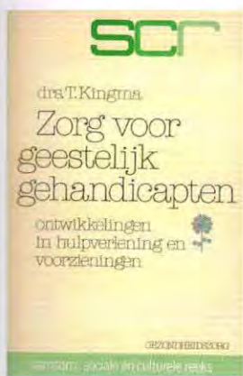
Het handboek vond een grote verspreiding in Nederland.