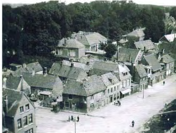
De blo-school aan de Boterhoek in Leeuwarden, geopend in 1927. Het was de eerste voorziening voor kinderen met een verstandelijke beperking in Friesland.