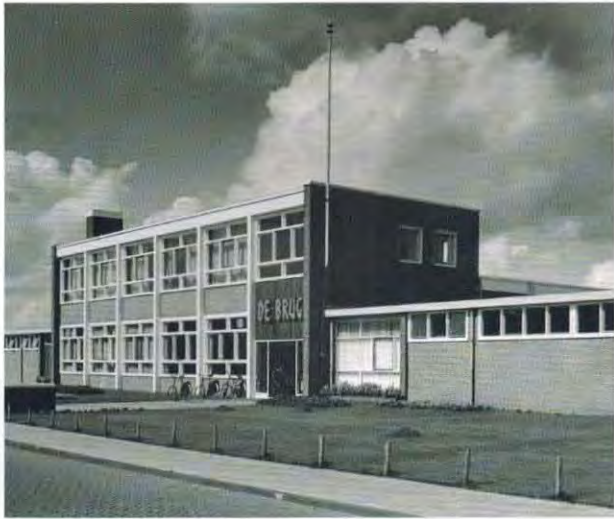
Sociale werkplaats De Brug in Drachten.

maatschappelijke hindernis vormde voor jongeren. In 1942 kreeg hij een aanstelling aan de blo-school in Dokkum, maar die sloot twee jaar later zijn deuren omdat er geen vervoer meer was voor de kinderen. Kingma sloot zich in het laatste oorlogsjaar aan bij de Binnenlandse Strijdkrachten. Een lichtpunt in deze sombere jaren was zijn verloving met Jikke van Tuinen.