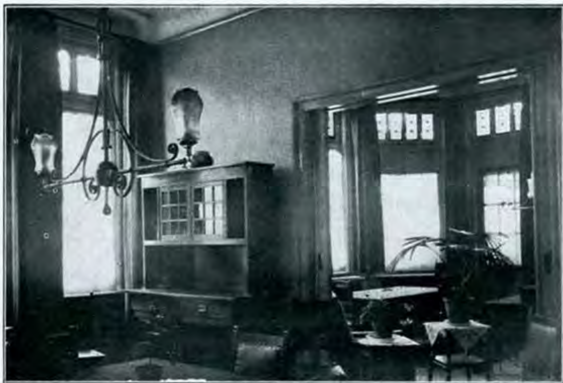
Eetkamer en Salon in Paviljoen D

begonnen, beteekende allereerst te vragen, wanneer onze goede vrienden ons in staat zullen hebben gesteld een nieuw ontspanningshuis te bouwen, waaraan groote behoefte bestaat.