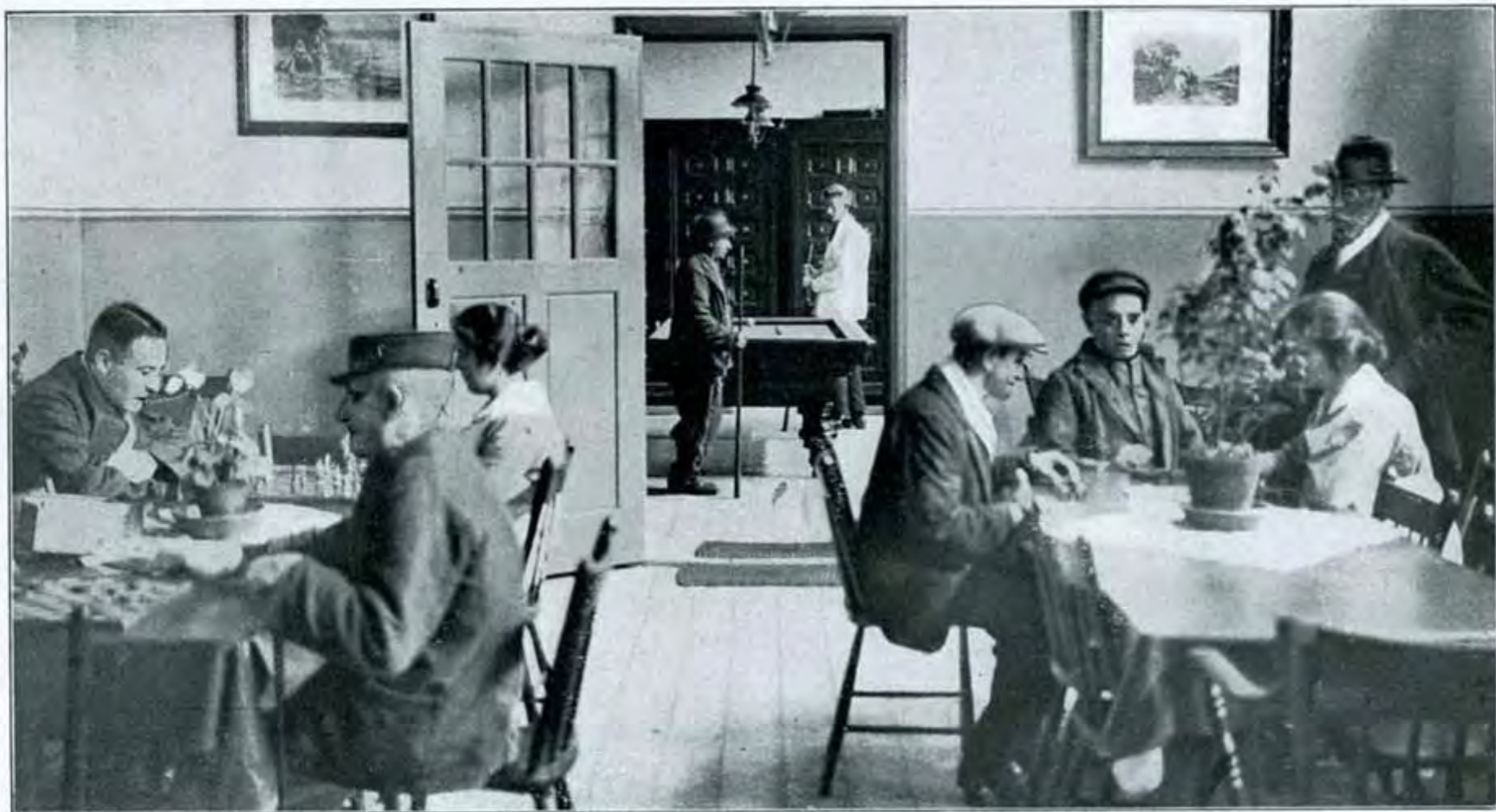
Dagverblijf in Paviljoen C (mannen 3de klasse) (De gezichten van op deze en andere foto's afgebeelde verpleegden zijn op het cliché veranderd)