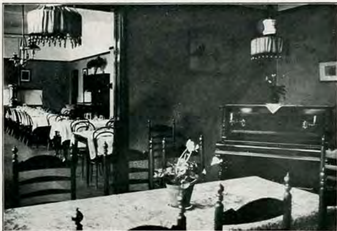
Eet- en gezelschapszalen der zusters

1933 betrokken moet worden. Het aantal verpleegden in Het Apeldoornsche Bosch, Rustoord en Krankzinnigengesticht tezamen, bedraagt nu 730.