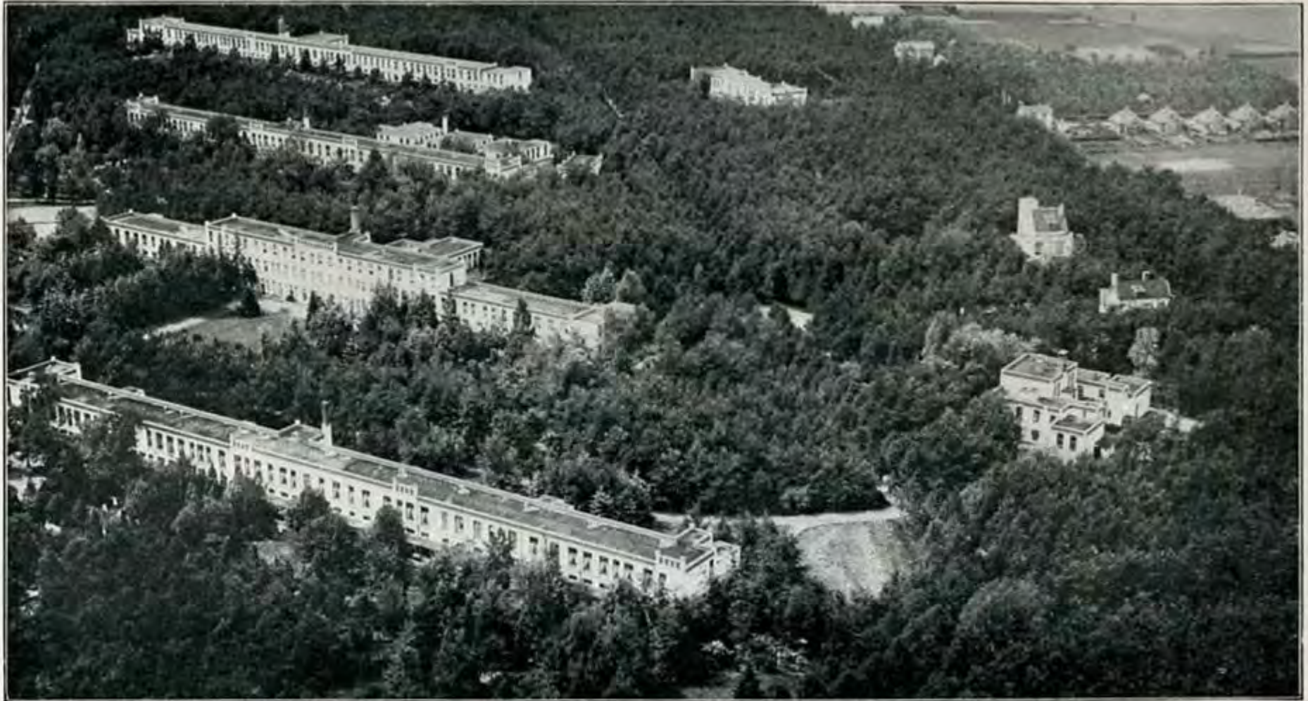
Het Apeldoornsche Bosch