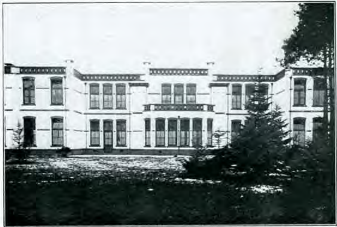
Paviljoen D (1ste en 2de klasse)

der Personeel-Vereeniging Nieuw Leven. Deze vereeniging, die een groot deel van het personeel omvat, speelt een belangrijke rol in zijn bestaan: haar sportafdeeling speelt voetbal of korfbal op het sportterrein op de Sara-Hoeve; de afdeeling voor feestjes huldigt bijv. in feestelijke samenkomst hen, die de examens goed hebben doorstaan; de afdeeling voor lezingen vereenigt dikwijls hen, die in de groote vragen van den dag belangstellen, onder het gehoor van bevoegde sprekers — meestal in de „conver” (huiskamer) of de eetzaal der zusters. De Wolff-Nijkerkzaal werd intusschen te klein, en haar ruimte moest voor andere doeleinden in beslag worden genomen; het vraagteken aan het einde van het kroniekje, waarmee wij dit geschriftje