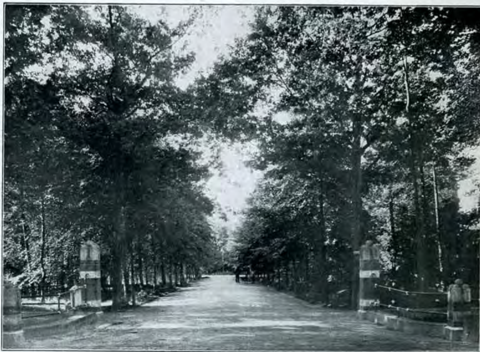
Hoofdingang van „Het Apeldoornsche Bosch“