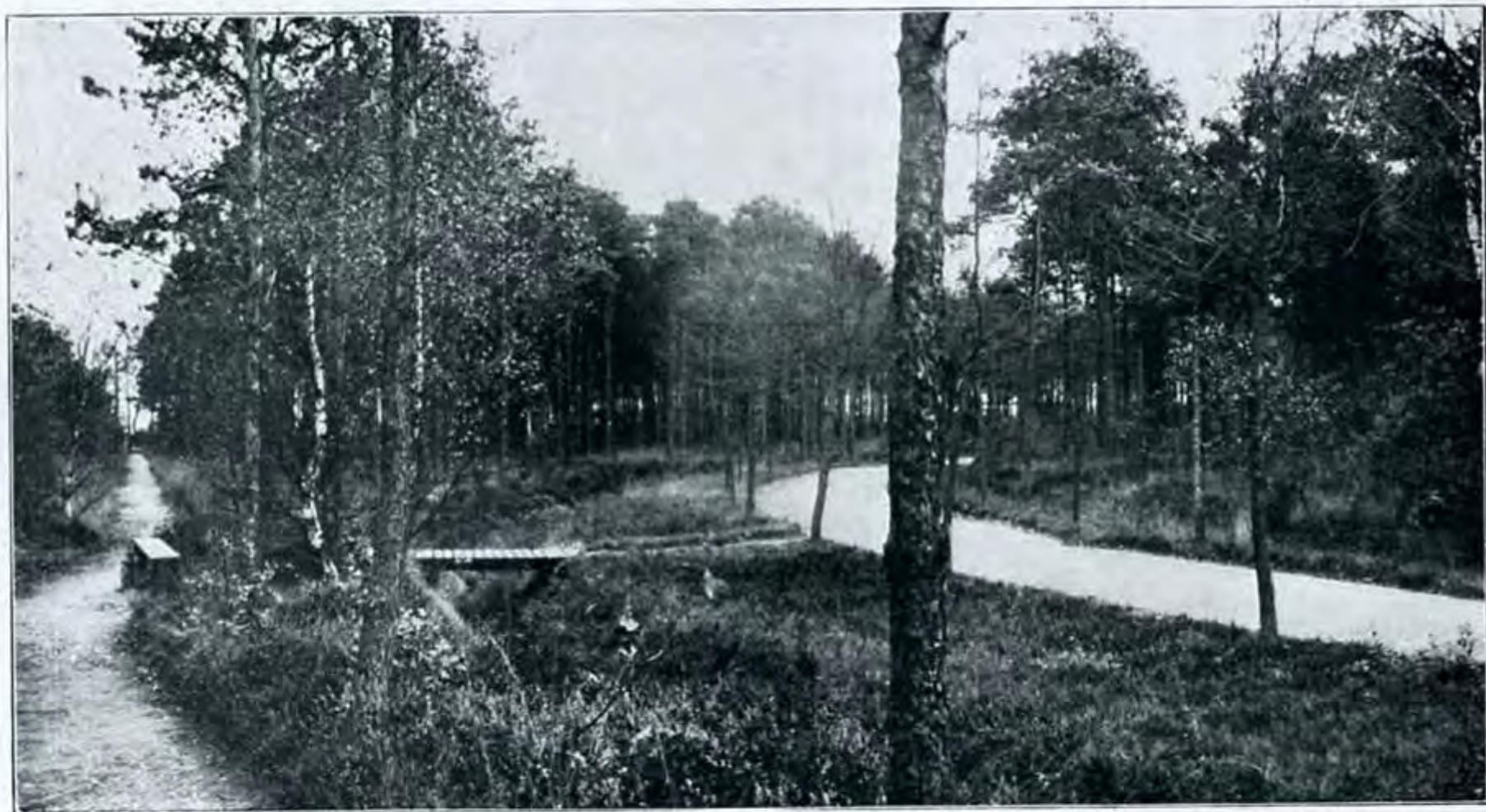
In het Park