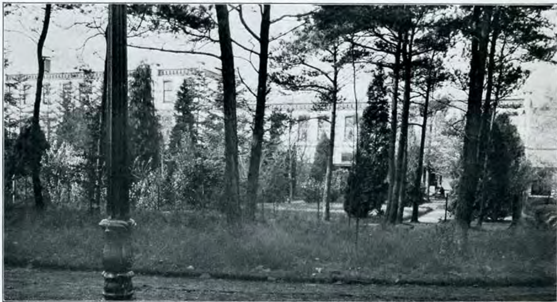
Sanatorium Rustoord Vrouwen-afdeeling