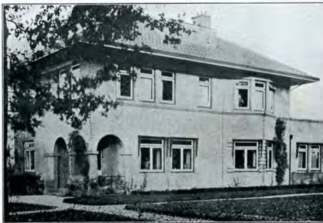
Woning van den Geneesheer-Directeur

32 mannen en 12 jongens in gebruik genomen. Derde vergrooting van het Kinderhuis Paedagogium Achisomog , dat nu officieel ook Observatie-inrichting is geworden; Definitief besluit tot den bouw van een nieuw Kinderhuis , dat uiterlijk op 1 Juli