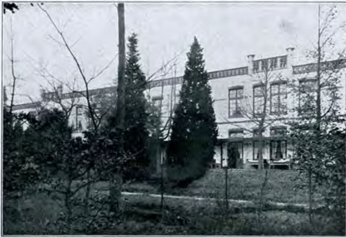
Paviljoen B (vrouwen 3de klasse)

er van het station Apeldoorn af heen, maar een geriefelijke autobus maakt het tegenwoordig gemakkelijker het gesticht te bereiken. Ge ziet al aanstonds, dat er van het oude Apeldoornsche Bosch niet zoo heel veel over is. Aan de linkerzijde van den straatweg is alles weg; tegenover den hoofdingang ligt daar de Sara-Hoeve, een terrein door een goeden vriend ons geschonken en reeds bebouwd met een aantal woningen voor leden van het personeel, waar-