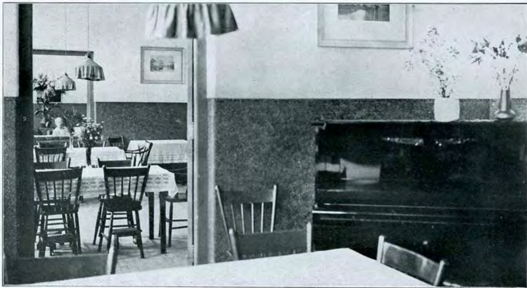
Dagverblijf in Paviljoen E (vrouwen 3de klasse)