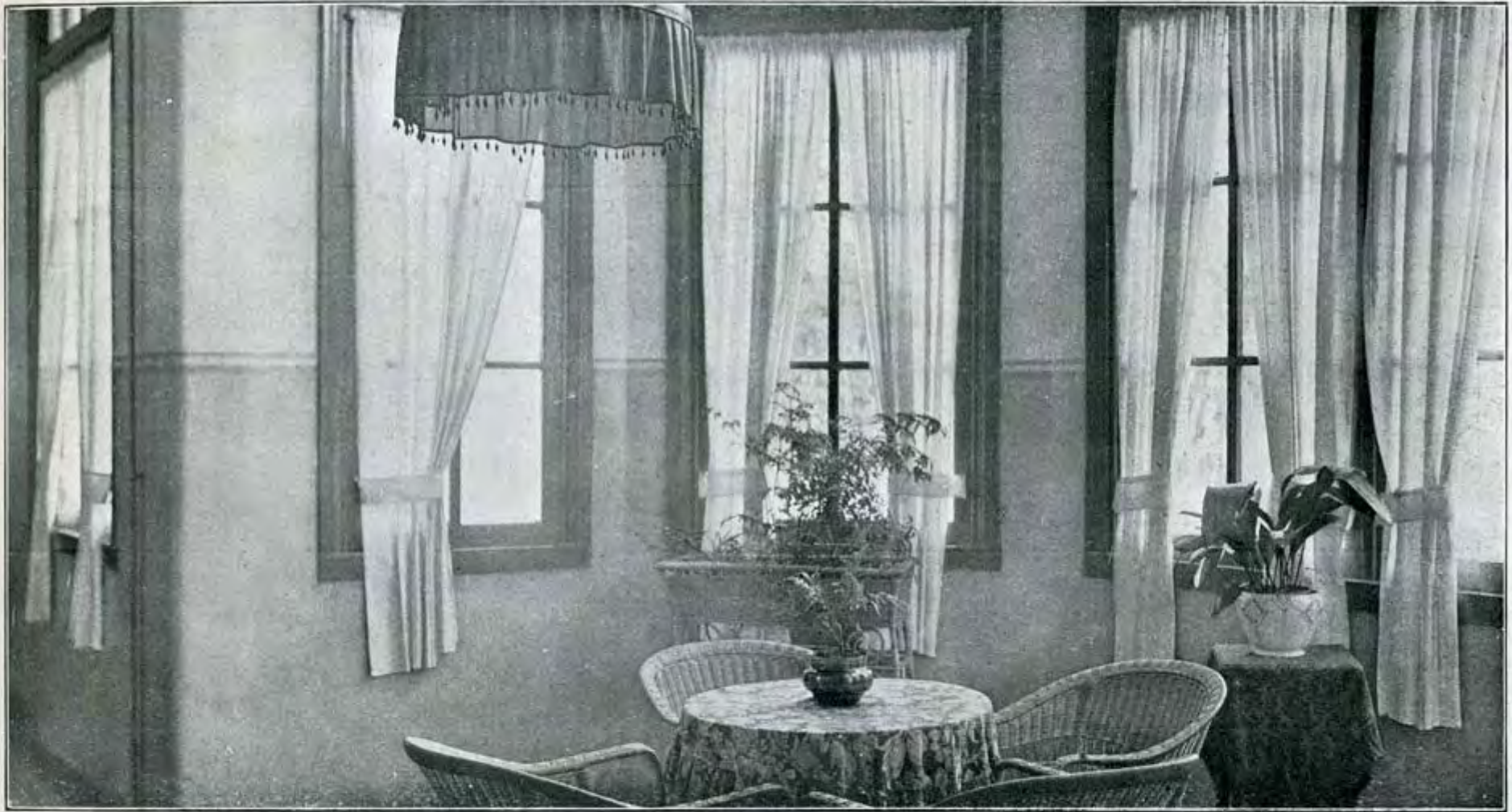
Erker in Paviljoen C (mannen 3de klasse)