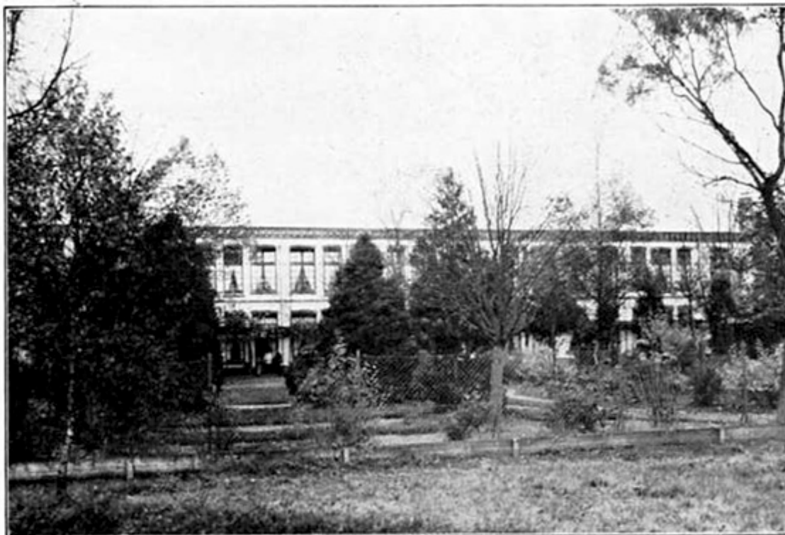
Paviljoen C (mannen 3de klasse)

patienten tot rust te brengen, dat we voor een belangrijk deel te danken hebben aan de Stichting „Hulp na Onderzoek”. Een wandeling door het park brengt ons langs de barak voor besmettelijk-zieken, die gelukkig nog nimmer voor haar eigenlijk doel behoefde te