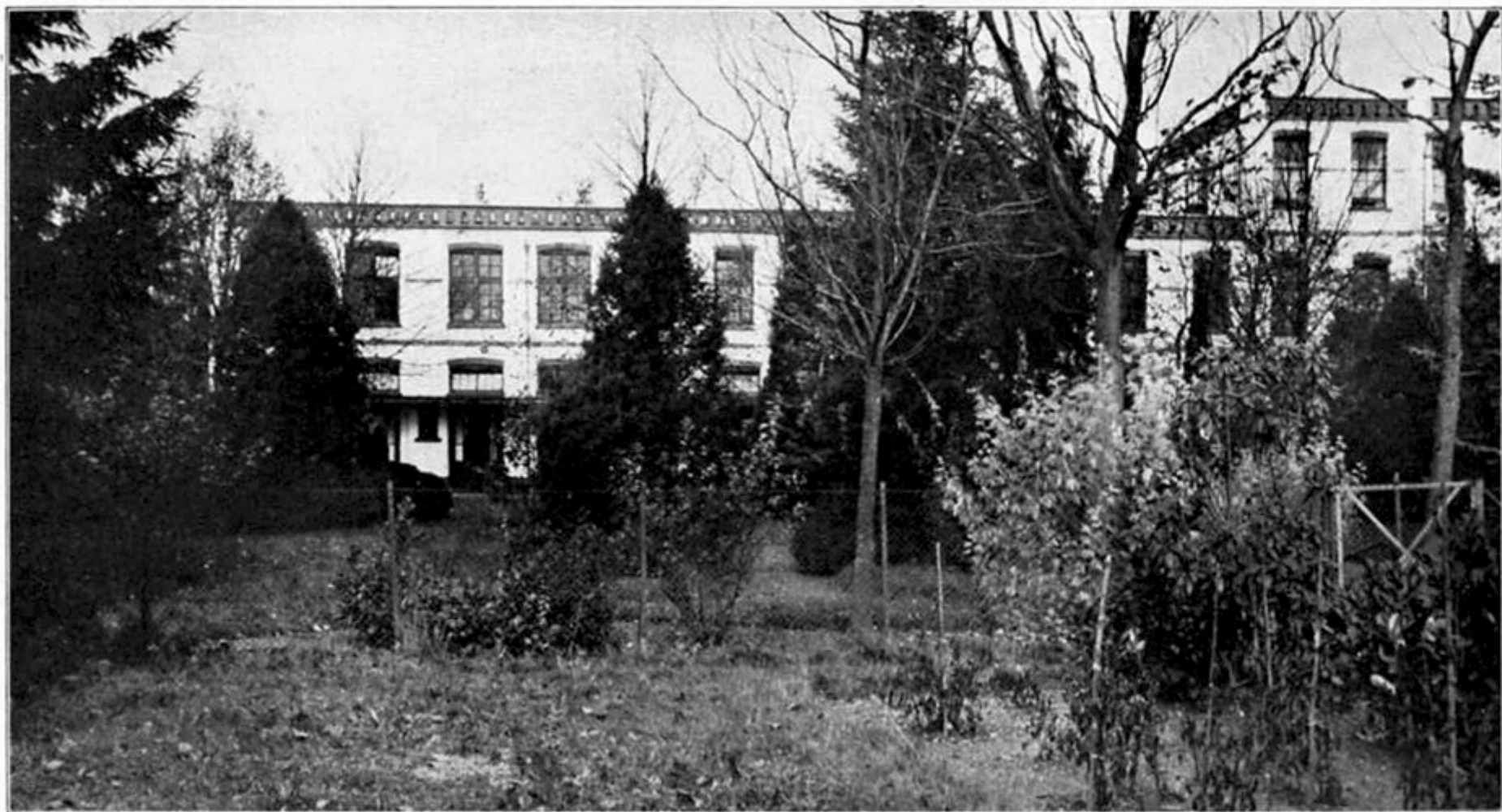
Sanatorium Rustoord Mannen-afdeeling