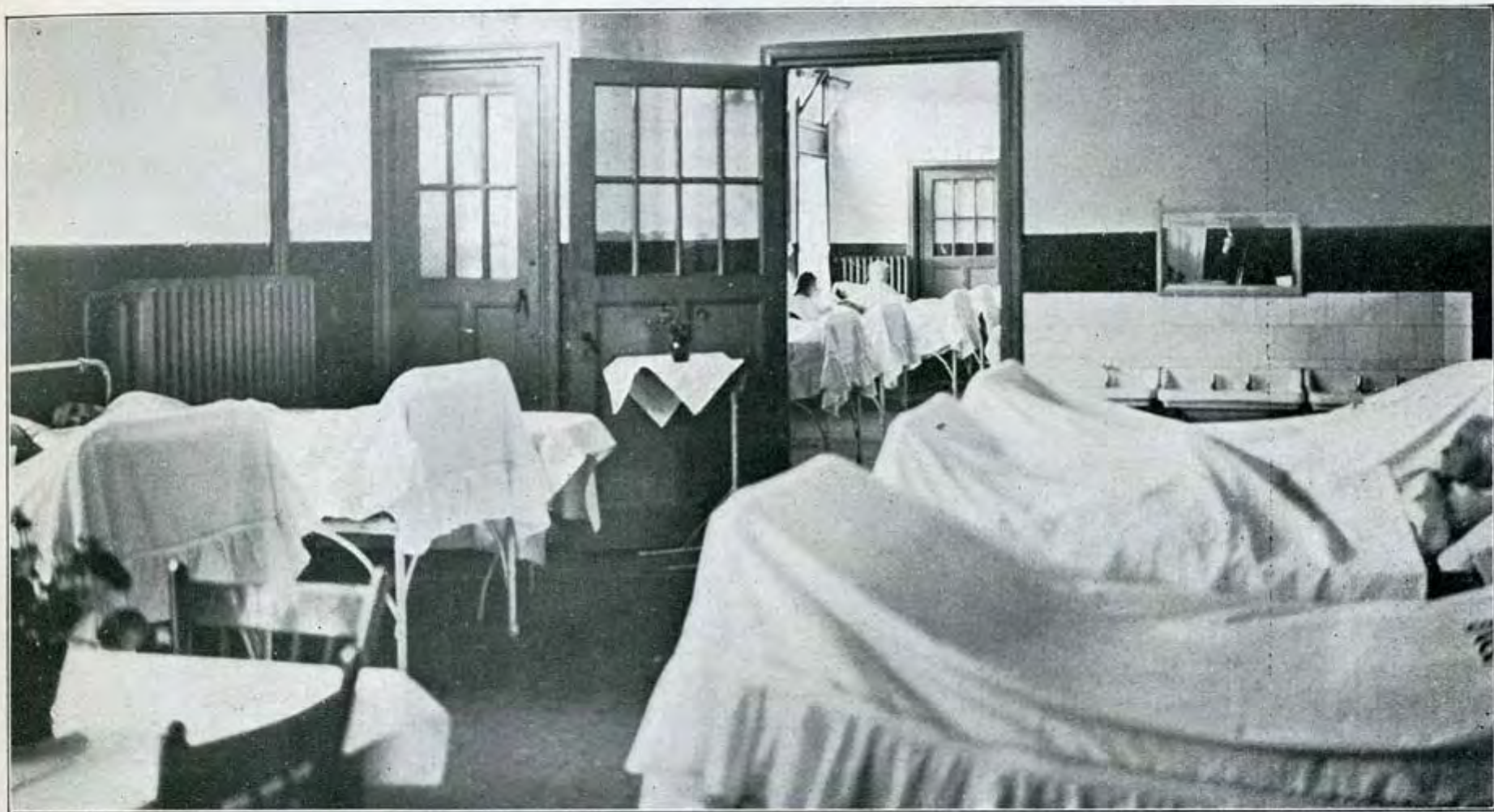
Ziekenzalen in Paviljoen E (vrouwen 3de klasse)