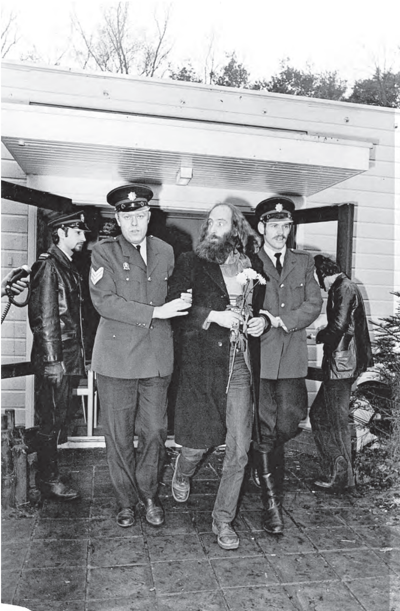
Ontruiming van de directieket van Dennendal, 1974.